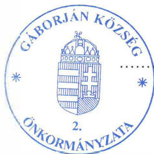
Mező Gyula Polgármester